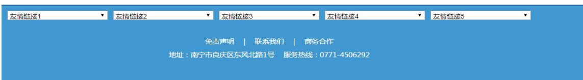
图 2-1 第一次公示网络截图