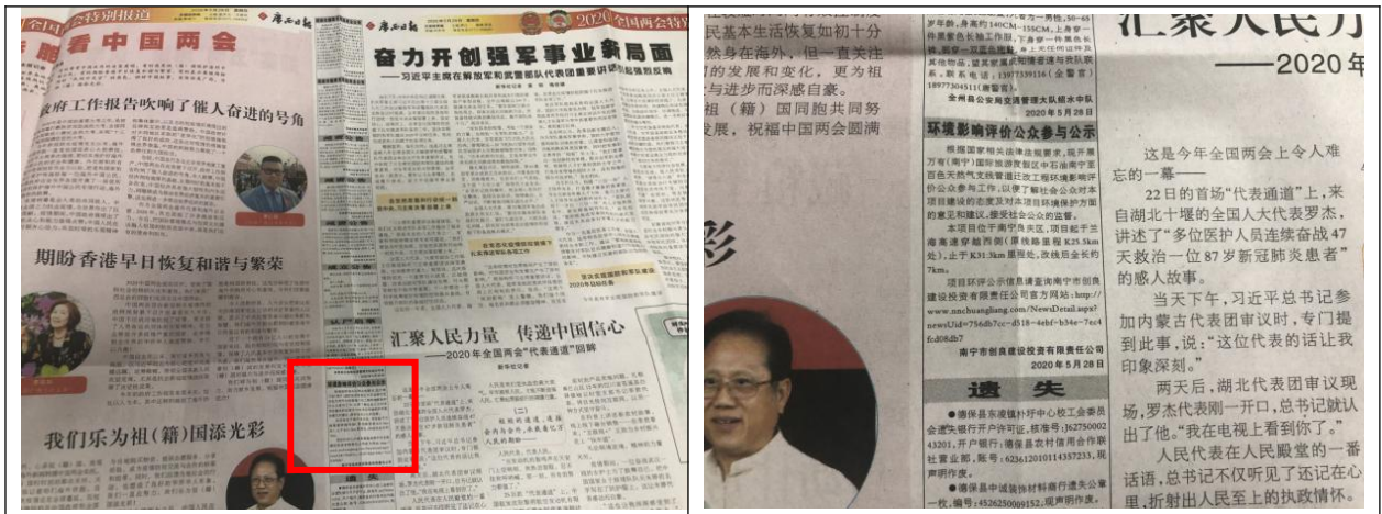
图 3-2 第一次报纸公示

本单位于2020年5月28日、29日通过广西日报对项目进行了两次公示，公开项目建设概况及项目其他信息获取途径。公示内容见图3-2~图3-3。