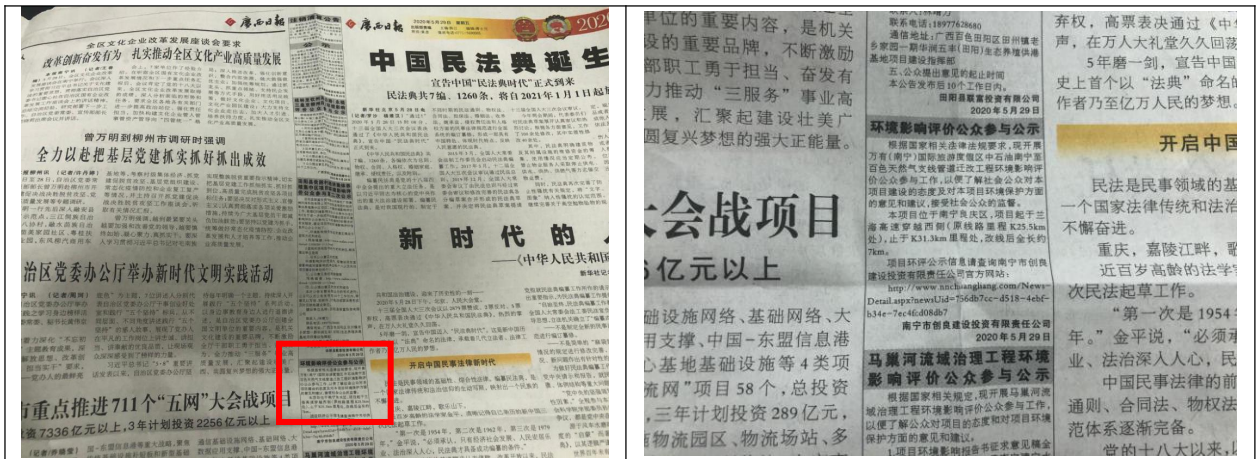
图 3-3 第二次报纸公示