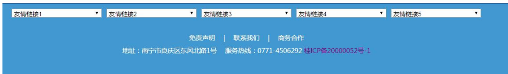
图 3-1 第二次公示网络截图